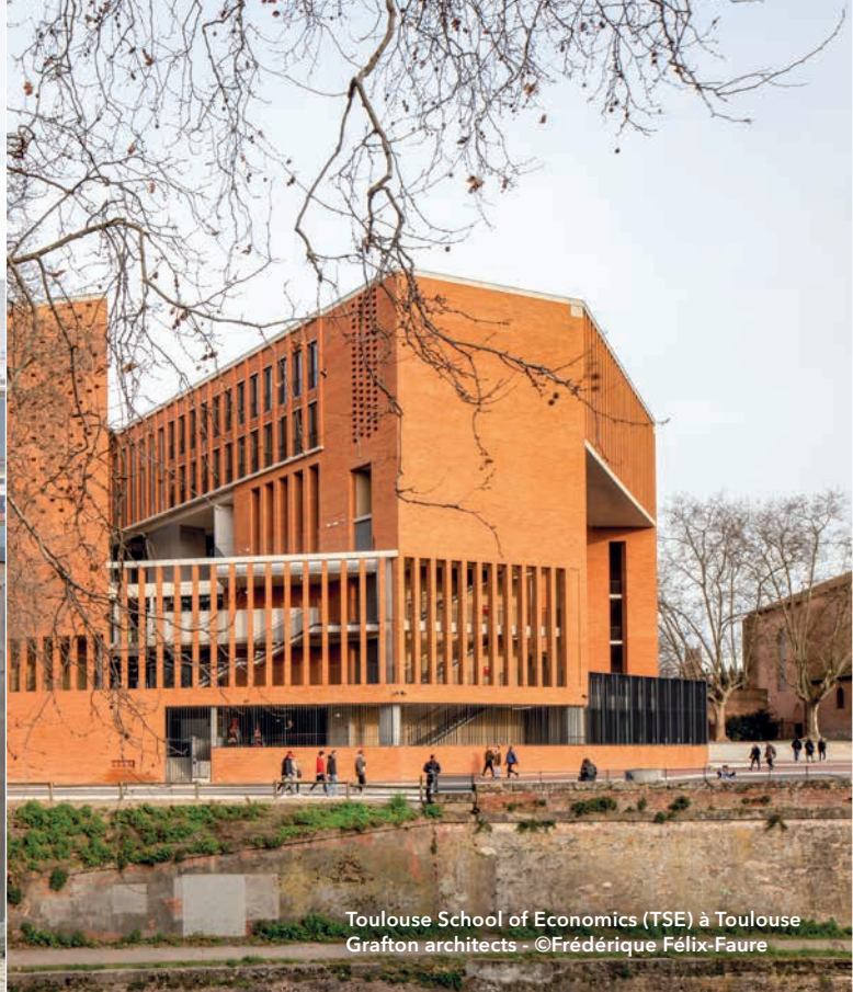
Toulouse School of Economics (TSE) à Toulouse Grafton architects - ©Frédérique Félix-Faure