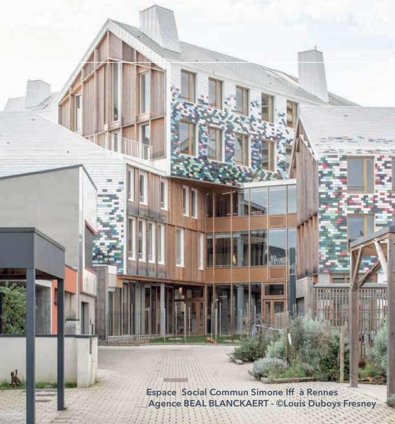
Espace Social Commun Simone Iff à Rennes Agence BEAL BLANCKAERT