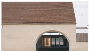
NON RÉSIDENTIEL/TERTIAIRE 1ER PRIX EX AEQUO GROUPE SCOLAIRE CLAUDE SCHILMÖLLER TRACKS ARCHITECTES BRUYERES SUR OISE (95)