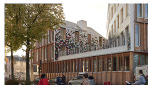
NON RÉSIDENTIEL 1ER PRIX EX AEQUO ET PRIX DU PUBLIC ESPACE SOCIAL COMMUN SIMONE IFF BÉAL & BLANCKAERT ARCHITECTES URBANISTES RENNES (35)