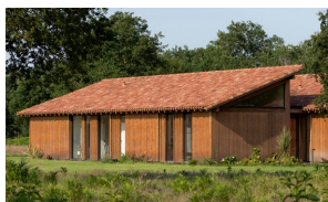
LOGEMENT INDIVIDUEL 1ER PRIX MAISON AIRIAL OECO ARCHITECTES LANDES (40)

La remise des prix a eu lieu le 14 novembre 2024 à l'Ecole nationale supérieure d'architecture de Nancy en présence de plus de 200 architectes, étudiants en architecture et professionnels.