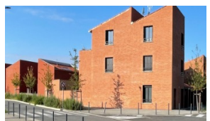
HABITAT INTERMEDIAIRE PRIX MENTION DEMARCHE ARCHITECTURALE CASTELMEW ATELIER CUBE SEILH (31)